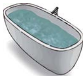
Baignoire 120 à 150 l