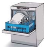
Lave vaisselle 10 à 18 l