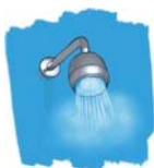
Douche 20 à 60 l