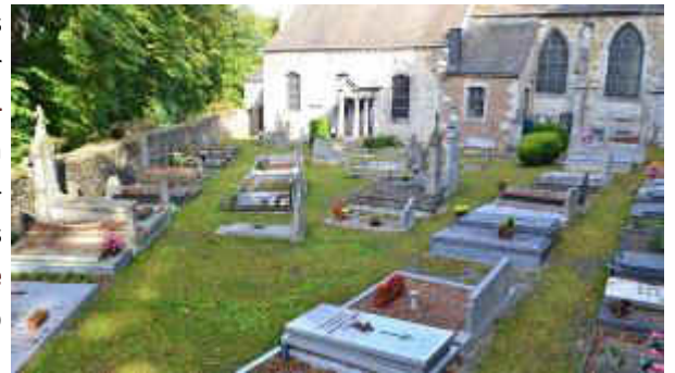
Un cimetière de Namur

Partout où il y a des graviers, il y a des mauvaises herbes. Et sans pesticide, il est difficile de lutter contre ces envahisseuses. Le principe est donc d'enlever le gravier et d'y mettre de l'herbe dense, à pousse lente à la place. Au lieu de désherber le gravier, on va l'enherber, on va semer des plantes, des graminées, des plantes basses. Puis on va tondre régulièrement et le cimetière sera ainsi beaucoup plus vert.